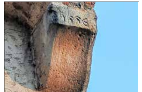
Abb. 2: Kragstein mit der Jahreszahl 1556

Ziffernblätter kamen später hinzu. Ein Uhrwerk wurde erst 1876 eingebaut. Bis 1874 bewohnte der Zöbiger Stadtbläser den Halleschen Turm, bis 1891 ein Türmer bzw. Hausmann. (Fortsetzung folgt.)