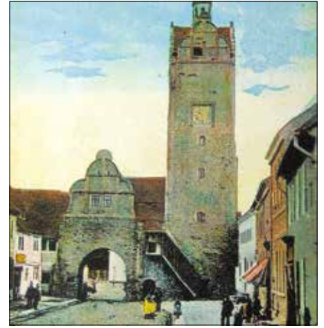
Abb. 1: Das Hallesche Tor in Zöbzig (1891)