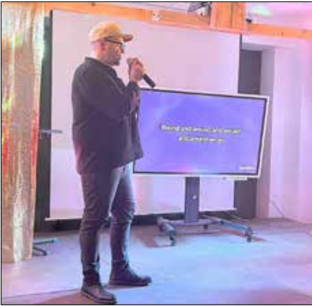
Gewinner des Karaoke-Abends

Was für ein Wahnsinn! Am 06.03.2026 öffnete Gut Möblitz die Türen der Kulturscheune und zeigte sich von seiner besten, musikalischsten Seite. Der Ansturm war größer als erwartet - doch genau das machte den Abend erst zu dem unvergesslichen Erlebnis, das er geworden ist. Die Hütte war rappellvoll, der Karaokeabend offiziell ausgebucht und die Stimmung sprang von Anfang an über.