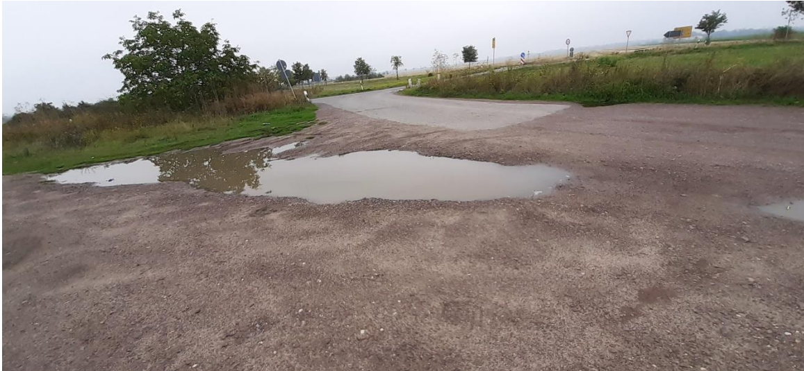
Foto 6: Flurstück 820 – Kompensationsmaßnahme der LSBB-Ost LSA – westlich des Untersuchungsgebietes