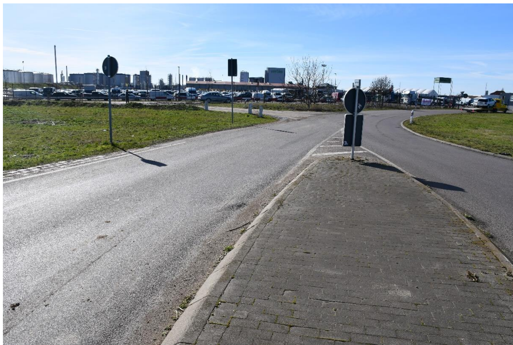
Blick Richtung Süden zum Gewerbegebiet