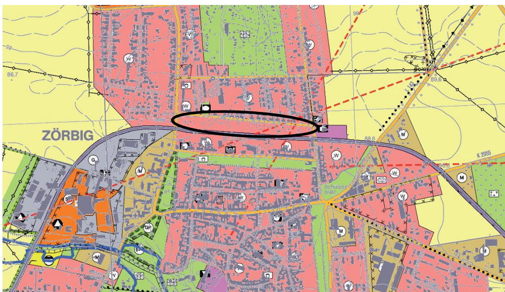
Abb. 3.2: Ausschnitt Flächennutzungsplan der Stadt Zörbig, OT Zörbig

Die Stadt Zörbig verfügt über einen rechtswirksamen Flächennutzungsplan (Ergänzung und Änderung, rechtswirksam seit 5. Mai 2017). Darin ist das Plangebiet bereits als Wohnbaufläche ausgewiesen. Insofern kann der Bebauungsplan aus dem Flächennutzungsplan entwickelt werden. Zum Erfordernis der Entwicklung der Wohnbauflächen innerhalb des Stadtgebietes von Zörbig sind weitere Ausführungen unter Pkt. 6.1 zu finden.