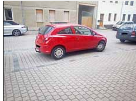
Innerhalb von vierseitig begrenztem schwarzen Pflaster.