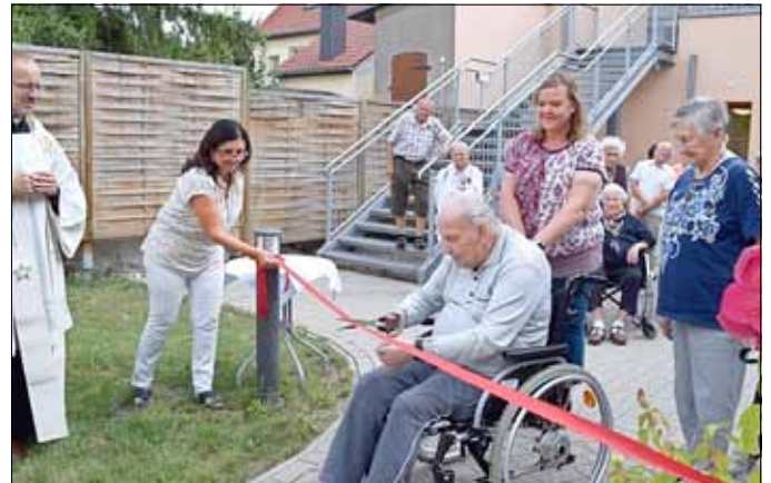
Einweihung des Barfußpfades