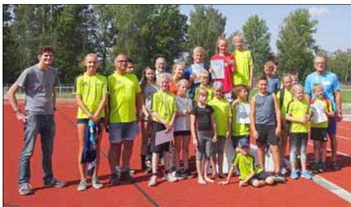
Mannschaft des SV Zöbzig