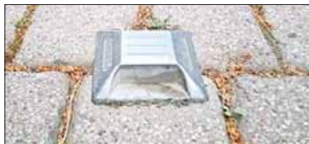
Im Bereich zwischen zwei oder mehrere Markierungsnägeln.

In verkehrsberuhigten Bereichen darf gemäß § 42 (2) i. V. m. Anlage 3 lfd. Nr. 12 der StVO außerhalb der dafür gekennzeichneten Flächen nicht geparkt werden, ausgenommen zum Ein- oder Aussteigen und zum Be- oder Entladen. Nachfolgende Fotos zeigen solche Markierungen auf: