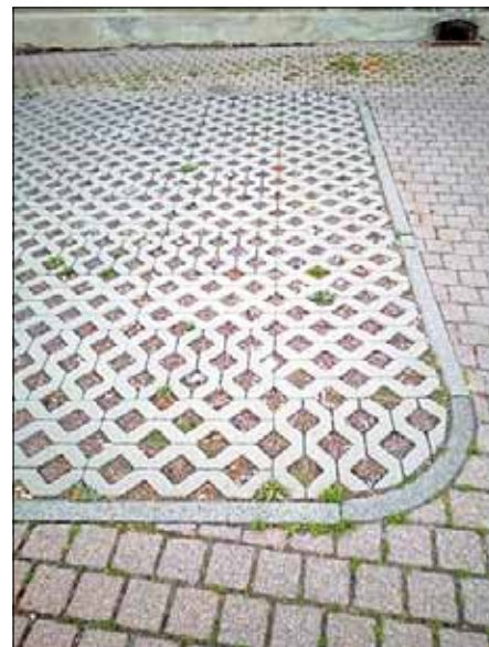
Im Bereich von Rasengitterpflaster.