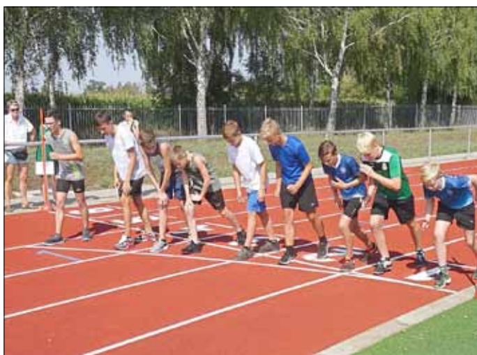
Start 800-m-Lauf männlich