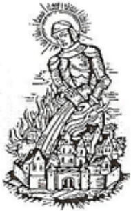
Heiliger St. Florian

Auf 73 Einsätze blicken die Zöbiger Feuerwehrmänner und -frauen im Jahr 2017 zurück. Eine große Bandbreite des Einsatzgeschehens war auch im vergangenen Jahr erkennbar. Es galt mehrere Brände